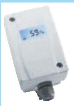
Display mit Beleuchtung Осветен дисплей

Temperaturkompensierend und langzeitstabil, mit Mehrbereichsumschaltung (8 Bereiche einstellbar), Genauigkeiten von \pm 1,5\% oder 3\% , Einstellung der Ansprechzeit, mit Nullpunktaste, beleuchtetes Display mit Einheitenanzeige optional mit Relay, als Druck- oder Volumenstromfühler.